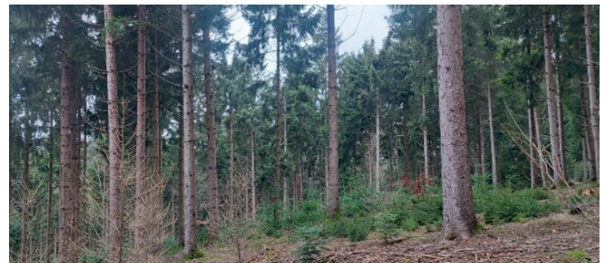
gleiche Fläche 2024

Werden bei Aufforstungen die Richtlinien für die Zusammensetzung der Baumarten eingehalten, werden die Kosten der Pflanzen über den Waldfond weitgehend abgedeckt. Zusätzlich gibt es für die Kulturpflege pro Pflanze einen Zuschuss.