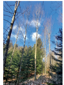
Text Josef Weigl

Waldpflanzenbestellungen sind jederzeit möglich unter: Tel. Nr.: 07217/20658